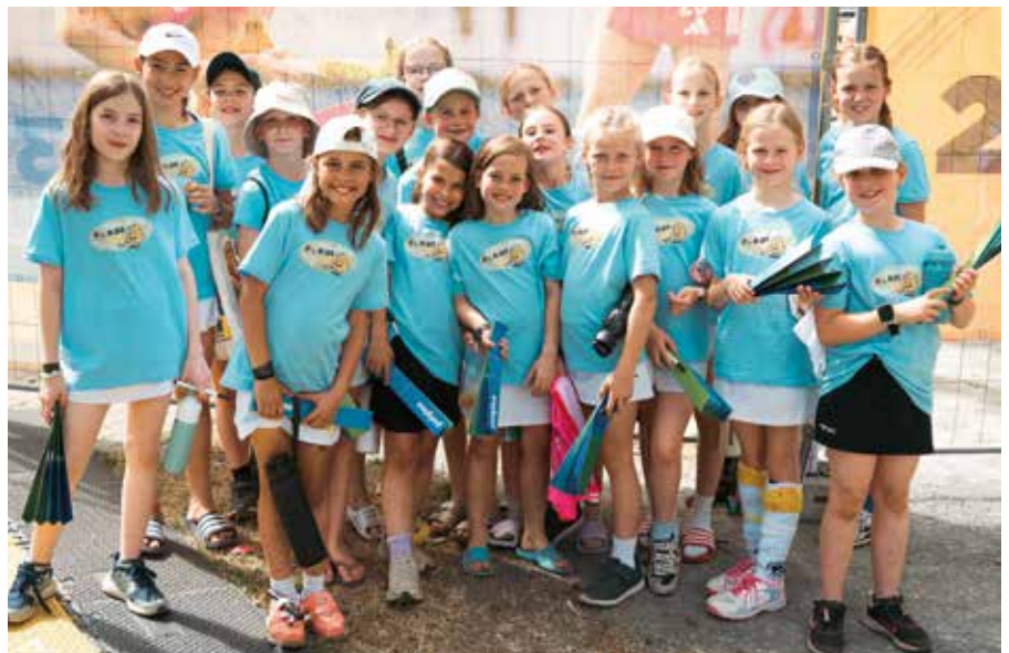
WU10 hatten viel Spaß beim Kidscup.

Team Weiß erwischte einen perfekten Start ins Turnier und blieb die gesamte Vorrunde ohne Gegentor. Das Zusammenspiel klappte, die Abwehr stand