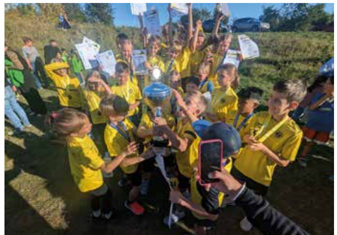
Den großen Pokal haben sich die U10 verdient.