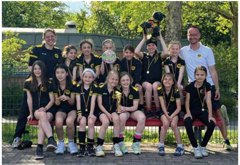
WU10 nach ihrem Sieg in Königs-Wusterhausen

Die WU10 erlebte in der Hallensaison Höhen und Tiefen, eines der Highlights war eine Auswärtsfahrt zum Turnier nach Köln (mit Abstecher in den Kölner Dom), wo der 6. Platz errungen werden konnte. Zugleich trat das Team im WU12-Pokal an, um Spielpraxis gegen ältere Teams zu sammeln. Beim Neujahrsturnier in Königs Wusterhausen gelang dem Team der Turniersieg, genauso wie beim Wespen Cup in der Sporthalle am Rohrgarten, wo es Siege gegen die Wespen, Dresden und den Berliner HC gab – schon nach dem ersten Turniertag war dem Team der Turniersieg nicht mehr zu nehmen, was beim gemeinsamen Baden und anschließendem Nudelessen im Vereinsheim der Wespen gefeiert wurde. Im Feld startete die Mannschaft, trainiert von Alexandra Kunz und Dennis Wipplinger, direkt erfolgreich, mit einem hart erkämpften Turniersieg bei der Maisause des Steglitzer TK. Nach insgesamt 14 Turniere Spielen sicherte ein Tor von Hannah Leffler in der letzten Spielminute den ersten Platz vor Rotation Prenzlauer Berg. Wichtige Erfahrungen konnten dann bei