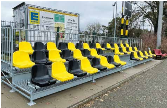
Die neue Tribüne an der Wanne