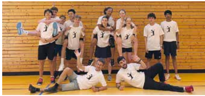
Trainingsgruppe und Trainer