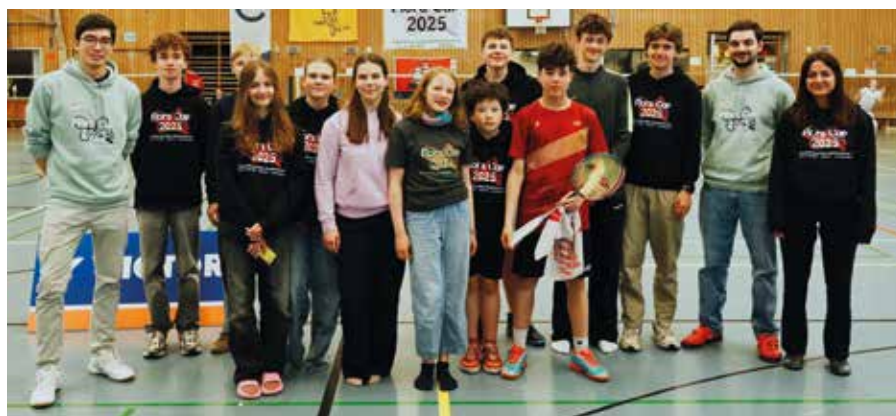
Teilnehmer und Trainer