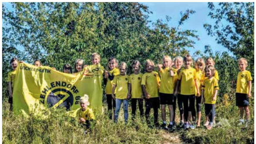
Finale in Kladow