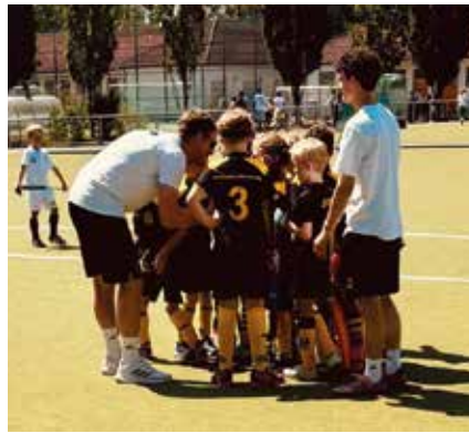
MU8 beim Kidscup zum Vorbereitungsgespräch

› viel Energie und Spielfreude in der Mannschaft steckt. Zwischendurch ging es als geschlossene Gruppe zu den ProLeague-Spielen. Autogramme, Fotos mit Nationalspieler/innen und Hockey aus nächster Nähe sorgten für strahlende Augen – fast so wichtig wie jedes Tor auf dem eigenen Feld. Am Abend rundete eine gemeinsame Burgerrunde den Tag ab. Am Sonntag schrieb Team Weiß dann seine kleine Erfolgsgeschichte: Im Halbfinale setzten sich die Jungs in einem