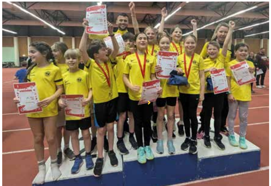
Große Freude bei den Jungs und Mädels von den U8-U12 beim Hallen Kids Cup