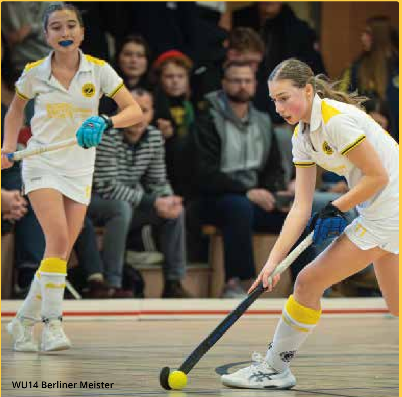
WU14 Berliner Meister